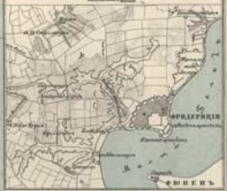
ПЛАНЪ ЮЖНОГО КРАЙНЕГО ПОЗИЦІИ 1:100,000. Издание 1894 г.